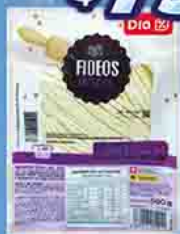
FIDEOS FRESCOS DIA X 500 G. PRECIO X KG: $ 1580