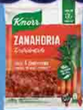
VEGETALES DESHIDRATADOS ZANAHORIA KNORR X 100 G. PRECIO UN. $9.900