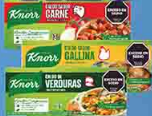
CALDO CARNE / GALLINA / VERDURA CON VEGETALES KNORR X 12 U. PRECIO UN. $93.33