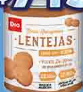
LENTEJAS SECAS REMOJADAS DIA X 300 G. PRECIO UN. $2.383.33