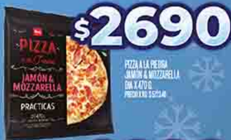
PIZZA A LA PIEDRA JAMÓN & MOZZARELLA DIA X 470 G. PRECIO X KG. $ 2690