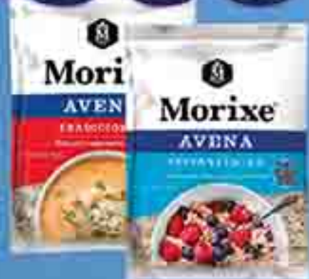
AVENA INSTANTÁNEA / TRADICIONAL MORIXE X 300 G. PRECIO UN. $3.000