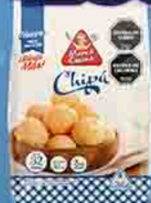
PREMEZCLA CHIPA MAMA COCINA X 400 G. PRECIO UN. $6.475