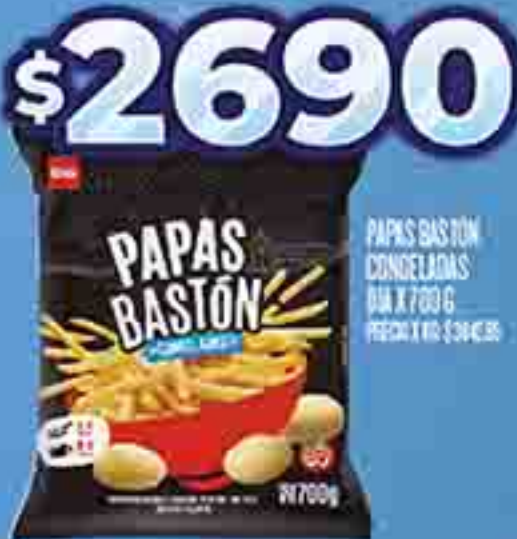
PAPAS BASTÓN CONGELADAS DIA X 700 G. PRECIO X KG. $ 2690