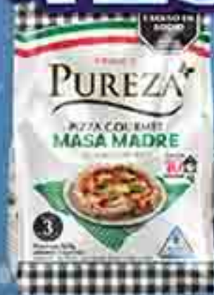
PREMEZCLA PIZZA MASA MADRE PUREZA X 550 G. PRECIO UN. $2.345.45