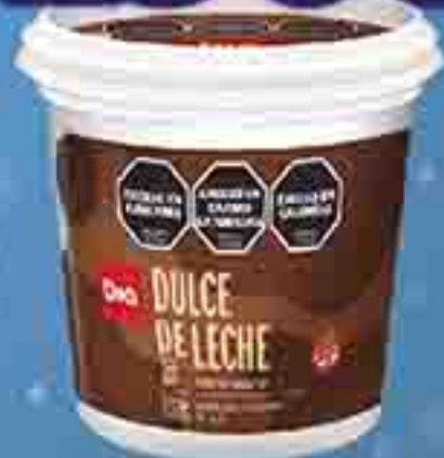
DULCE DE LECHE CLÁSICO DIA X 1 KG.