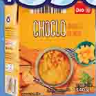
CHOCLO CREMOSO AMARILLO DIA X 340 G. PRECIO UN. $1.735.29