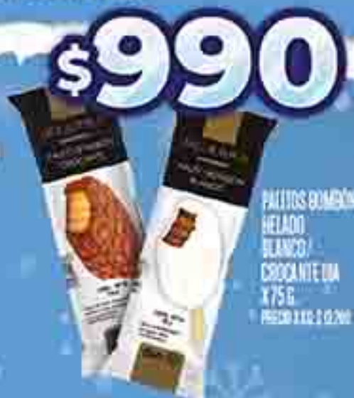
PALTOS DÁNICA HELADO BLANCO/ CROCANTE DIA X 75 G. PRECIO X KG. $ 990