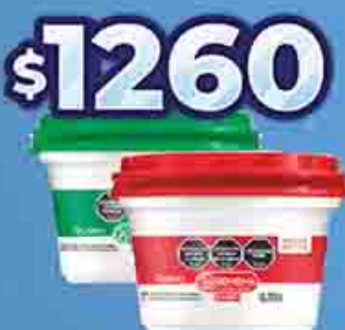
QUESO CLÁSICO LIGHT LA SERENÍSIMA X 195 G. PRECIO X KG. $ 1260