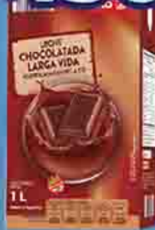
LECHE CHOCOLATADA LARGA VIDA DIA X 1 L.