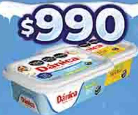
MARGARINA DORADA/ SOFT DÁNICA X 210/230 G. PRECIO X KG. $ 990