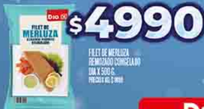
FILET DE MERLUZA REMOJADO CONGELADO DIA X 500 G. PRECIO X KG. $ 4990