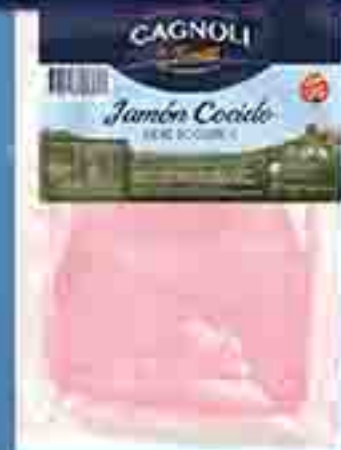
JAMÓN COCIDO FETEA DA CAGNOLLI X 200 G. PRECIO X KG: $ 11450