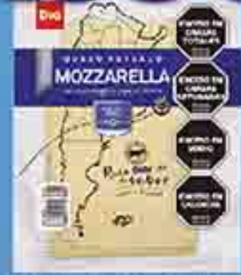
QUESO MOZZARELLA FETEA DA DIA X 170 G. PRECIO X KG: $ 1170,00