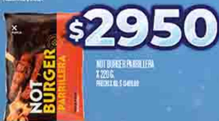
NOT BURGER PARRILLERA X 220 G. PRECIO X KG. $ 2950