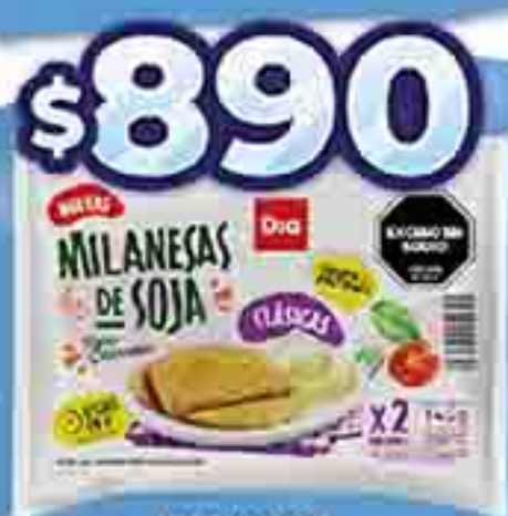
MILANESAS DE SOJA CLÁSICAS DIA X 145 G. PRECIO X KG. $ 890