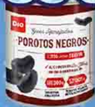
POROTOS NEGROS SECOS REMOJADOS DIA X 300 G. PRECIO UN. $2.966.67