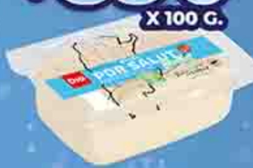
QUESO POPI SALUT SIN SAL DIA X 100 G. PRECIO X KG: $ 8900