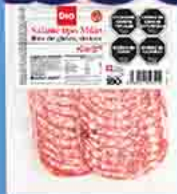
SALAME TIPO MILÁN FETAS FINAS DIA X 100 G. PRECIO X KG: $ 1995,50