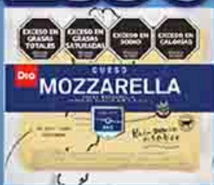
QUESO MOZZARELLA DIA X 250 G. PRECIO X KG: $ 10360