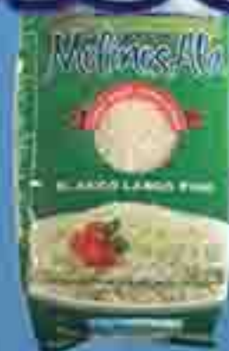
ARROZ LARGO FINO MOLINOS ALA X 1 KG.