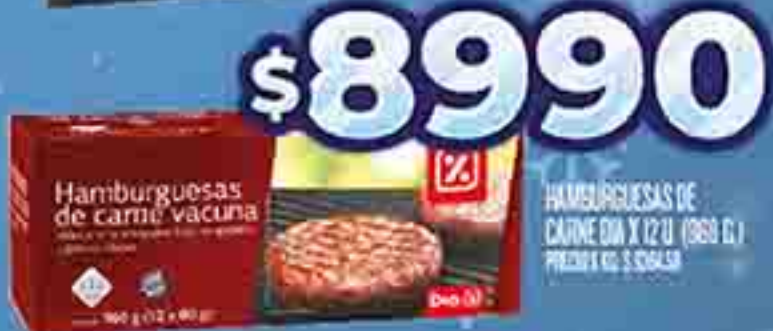
HAMBURGUESAS DE CARNE DIA X 12 U. (100 G.) PRECIO X KG. $ 8990