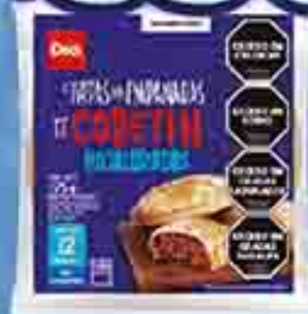
TAPAS PARA EMPANADAS DE COPETÍN HELAL DÍAS DIA X 175 G. PRECIO X KG: $ 3142,95