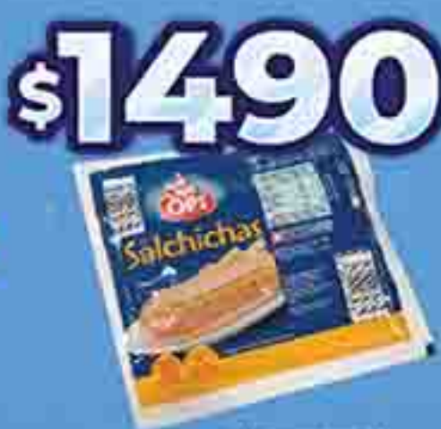
SALCHICHAS OPI X 216 G. PRECIO X KG. $ 1490