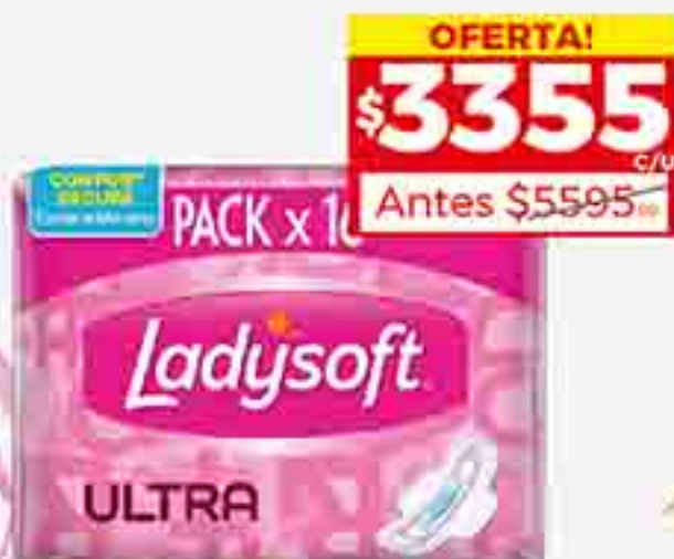
TOALLITAS FEMENINAS ULTRA SECA LADYSOFT X 10 U. PRECIO X U. $ 205.00 / STOCK: 3.000 U.