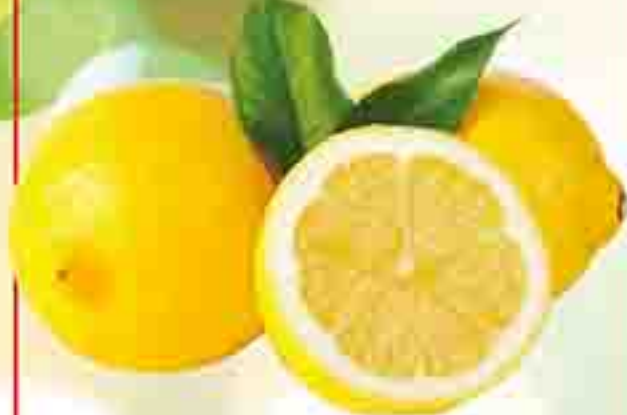
LIMÓN STOCK: 3.000 KG