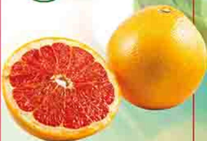
POMELO STOCK: 3.000 KG