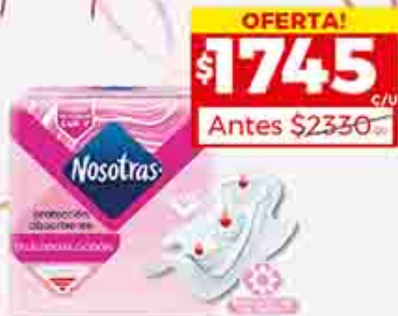
TOALLITAS FEMENINAS NOSOTRAS X 16 U. PRECIO U. $ 415.08 / STOCK: 3.000 U.