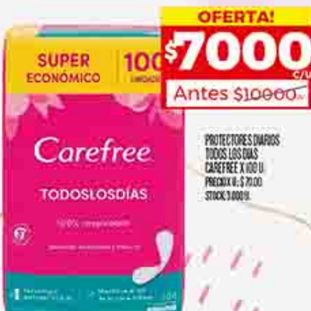
PROTECTORES DIARIOS TODOS LOS DIAS CAREFREE X 100 U. PRECIO U. $ 70.00 STOCK: 3.000 U.