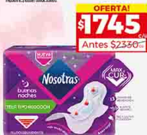
TOALLITAS FEMENINAS BUENAS NOCHES NOSOTRAS X 13 U. PRECIO X U. $ 210.37 / STOCK: 3.000 U.