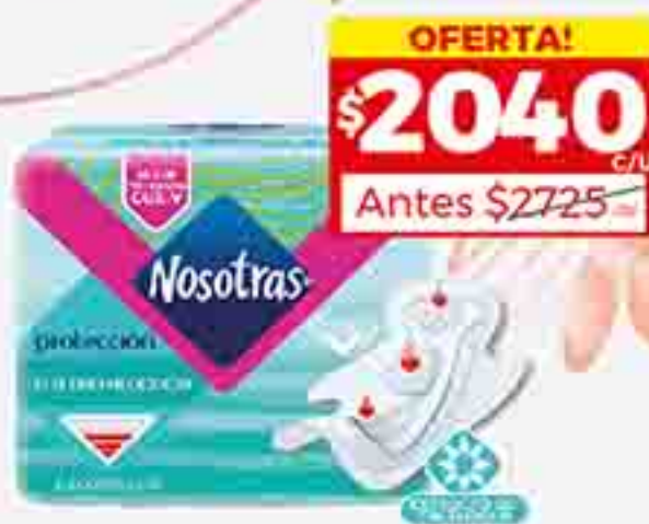
TOALLITAS FEMENINAS SUAVES NOSOTRAS X 15 U. PRECIO X U. $ 136.00 / STOCK: 3.000 U.