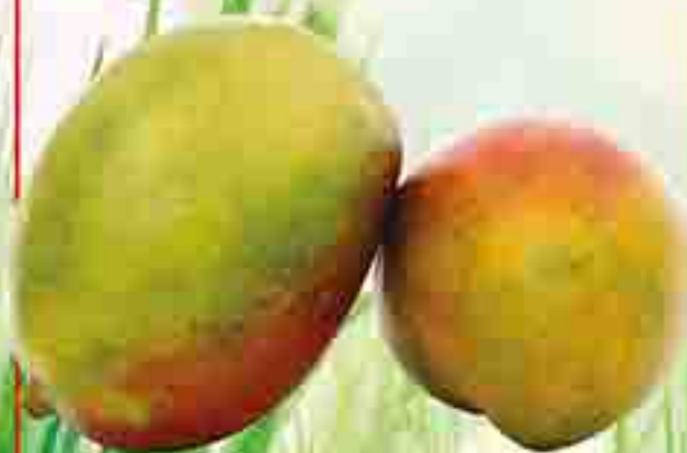
MANGO STOCK: 3.000 U