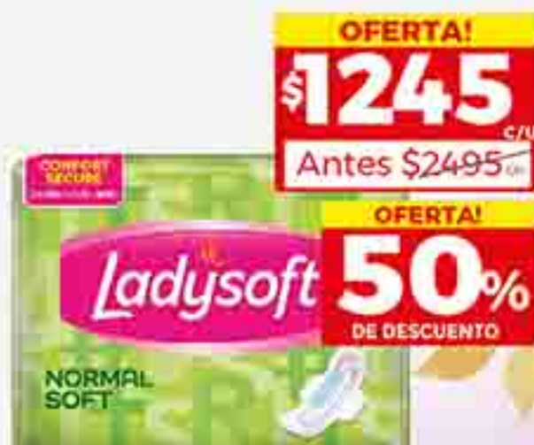
TOALLITAS FEMENINAS SUAVE LADYSOFT X 15 U. PRECIO X U. $ 83.00 / STOCK: 3.000 U.