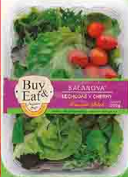
ENSALADA CLÁSICA BUY & EAT X 200 G. PRECIO X KG.: $ 9950 STOCK: 3.000 U.